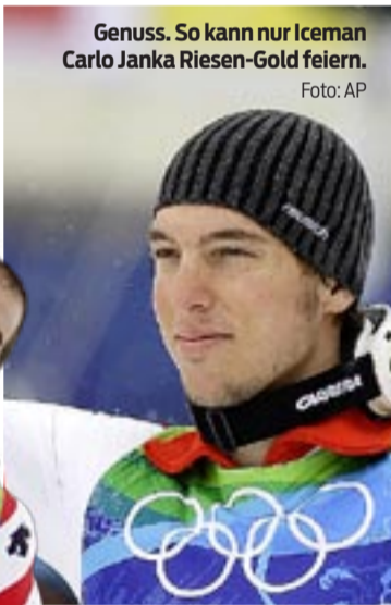
Genuss. So kann nur Iceman Carlo Janka Riesen-Gold feiern.