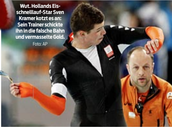
Wut. Hollands Eisschnelllauf-Star Sven Kramer kotzt es an: Sein Trainer schickte ihn in die falsche Bahn und vermasselte Gold.