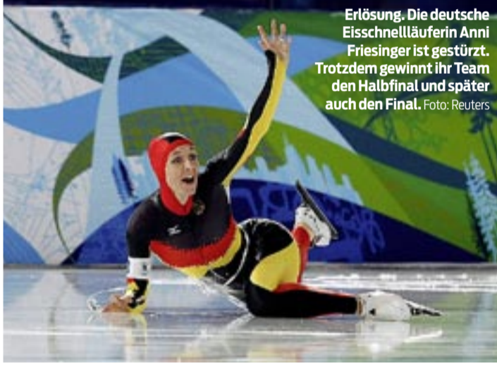
Erlösung. Die deutsche Eisschnellläuferin Anni Friesinger ist gestürzt. Trotzdem gewinnt ihr Team den Halbfinal und später auch den Final.