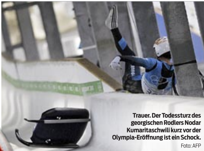
Trauer. Der Todessturz des georgischen Rodlers Nodar Kumaritashvili kurz vor der Olympia-Eröffnung ist ein Schock.