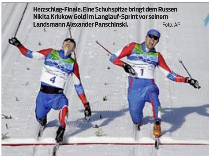
Herzschlag-Finale. Eine Schuhspitze bringt dem Russen Nikita Kriukow Gold im Langlauf-Sprint vor seinem Landsmann Alexander Panschinski.

Bekanntgabe von namhaften Beteiligungen i. S. von Art. 322 StGB: Additive Productions AG, Betty Bossi Verlag AG, Bolero Zeitschriftenverlag AG, ER Publishing SA, Geschenkidee.ch GmbH, Good News Productions AG, GRUNDTVY Schweiz AG, Investhaus AG, JRP Ringier Kunstverlag AG, ZR Media SA, Mediamat AG, media swiss ag, Original SA, Prevision AG, Presse TV AG, Radio AG, Radio Z AG, Rinovision AG, Sat.1 (Schweiz) AG, SMD Schweizer Medienanbieter AG, SMI Schule für Medienintegration AG, Telectub AG, Zana Media AG, Ringier France SA, Ringier Publishing GmbH, Juno Kunstverlag GmbH, Ringier (Niederlande) B.V., Ringier CR a.s., Ringier Kiadó Kft., Europress Kft., Eurimedia Bt., Nepszabadság Zrt., Ringier Slovakia a.s., Ringier Pacific Ltd., Ringier Print (HK) Ltd., Beijing Ringier International Advertising Co. Ltd., Ringier Vietnam Company Ltd.