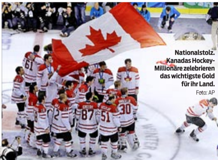
Nationalstolz. Kanadas Hockey-Millionäre zelebrieren das wichtigste Gold für ihr Land.