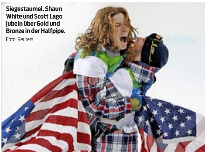
Siegestaumel. Shaun White und Scott Lago jubeln über Gold und Bronze in der Halbpipeline.